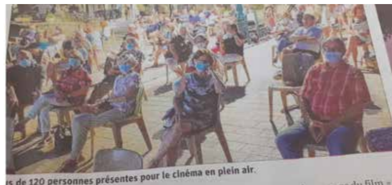
Plus de 120 personnes présentes pour le cinéma en plein air.

Les membres de Ciné C vous remercient de votre fidélité et vous donnent rendez-vous pour de prochaines manifestations, dès que le contexte le permettra.