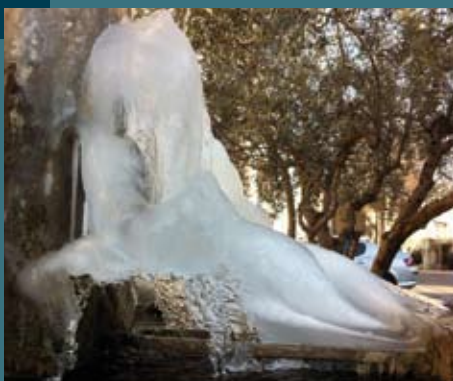
.. les reconnaissez-vous ?