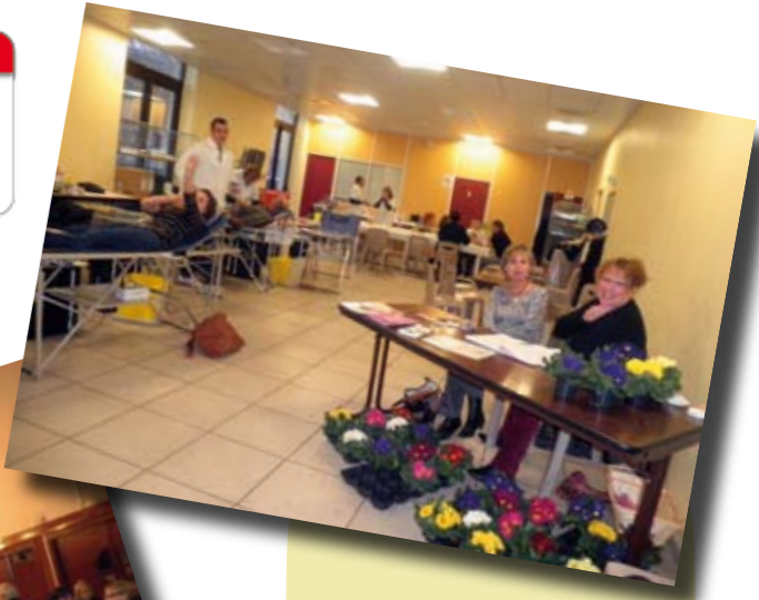
Collecte de Sang. De la couleur pour ce printemps, des primevères pour les donateurs. Encore 2 nouveaux donneurs.