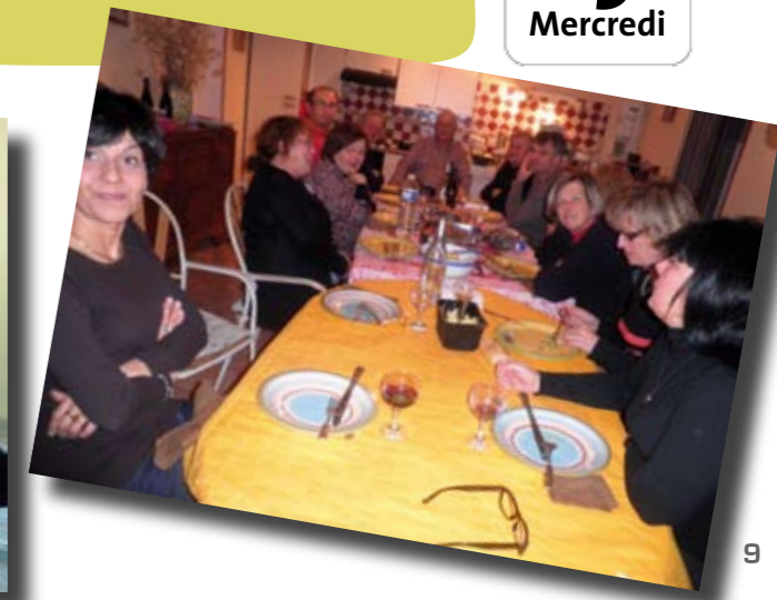
Réunion de préparation de la « Journée de la Femme ».