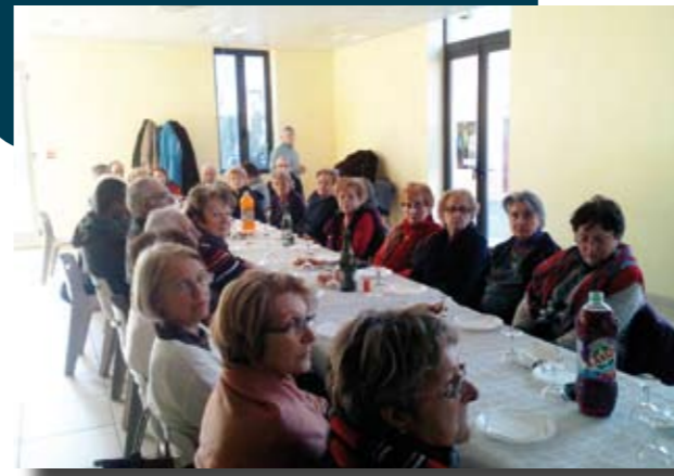
Gâteau des rois du Secours Catholique.