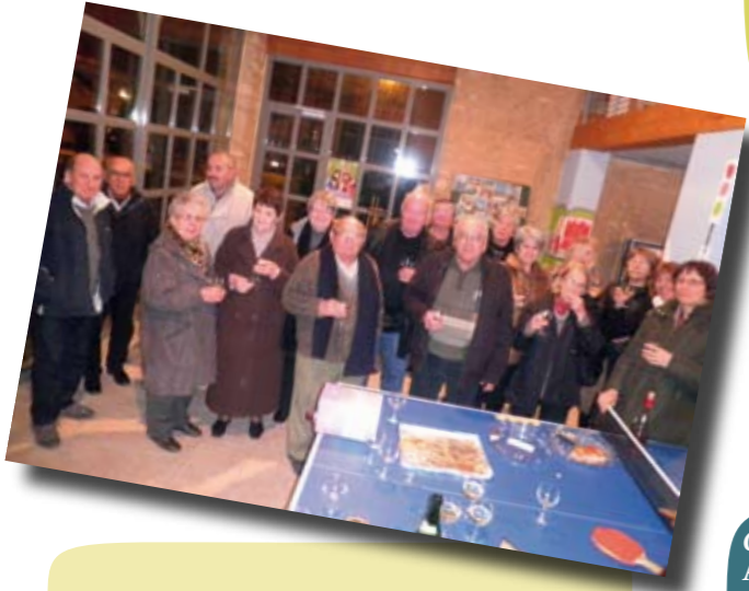
AG école Marius André suivi de la galette des Rois.