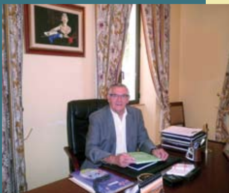
L'information municipale en direct