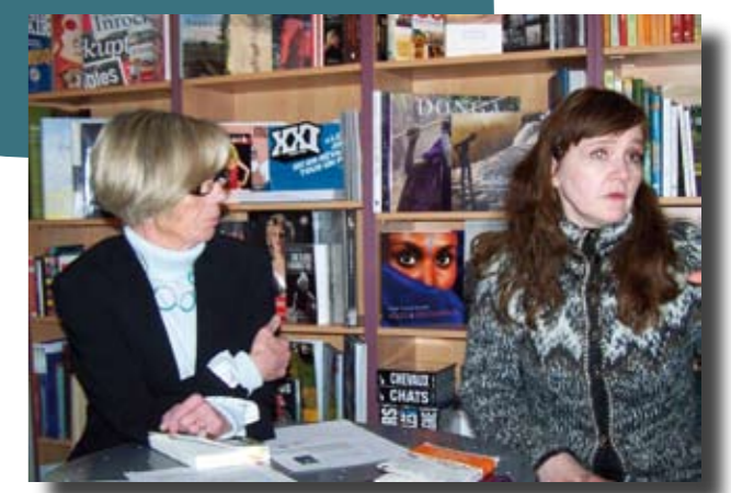
Lecture à la librairie avec la romancière Islandaise Audur Ava Olafsdottir