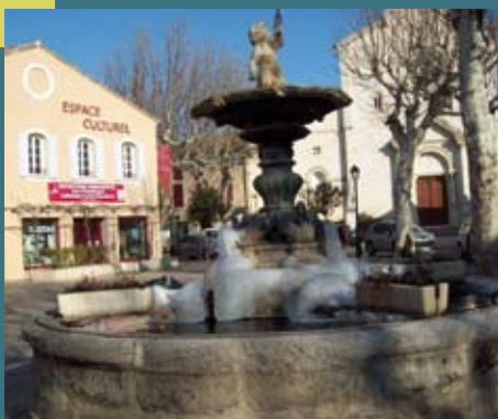
Les fontaines gelées, ...