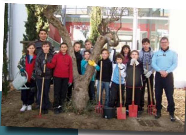
60 bulbes de la Tulipa Agenesis plantés au collège Victor Schoelcher... La verrons-nous réapparaître dans notre commune ?