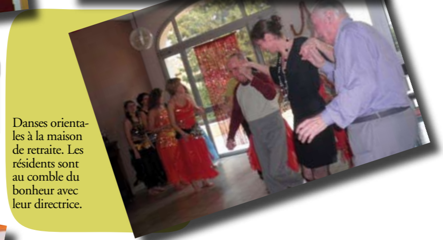
Danses orientales à la maison de retraite. Les résidents sont au comble du bonheur avec leur directrice.