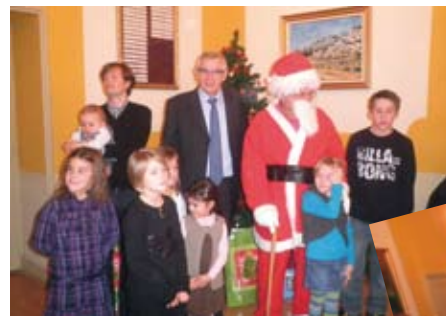
La mairie fête le Noël des enfants du personnel communal