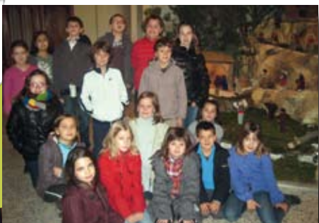
Préparation de la crèche à l'Eglise paroissiale avec les enfants du catéchisme