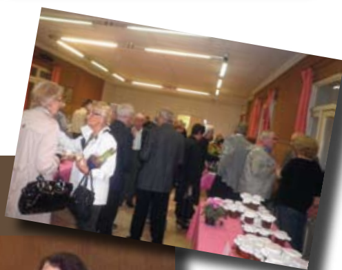
Kermesse du Foyer de l'Amitié