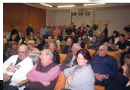
Les Amis de Phidias font leur théâtre