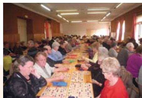
Loto du Foyer de l'Amitié