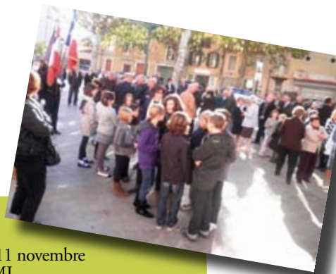
Commémoration du 11 novembre avec les enfants du CMJ