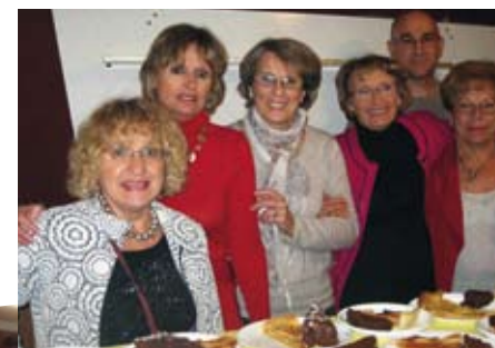
Ciné C prépare le repas de la soirée Téléthon. Films Tintin et Polisse.