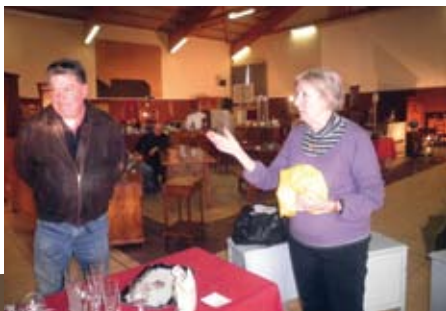
Salon des Antiquaires Salle Camille farjon 11 & 12 décembre