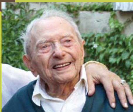
Hommage à Maurice Hébert