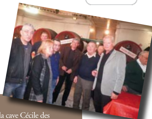
Journées Gourmandes à la cave Cécile des Vignes les 11 & 12 décembre