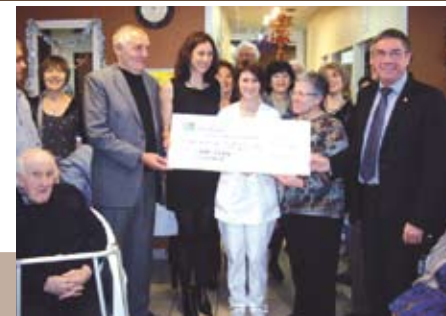
Le Lions Club d'Orange offre un chèque de 2300 euros à la Maison de Retraite.