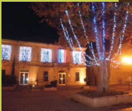
L'information municipale en direct