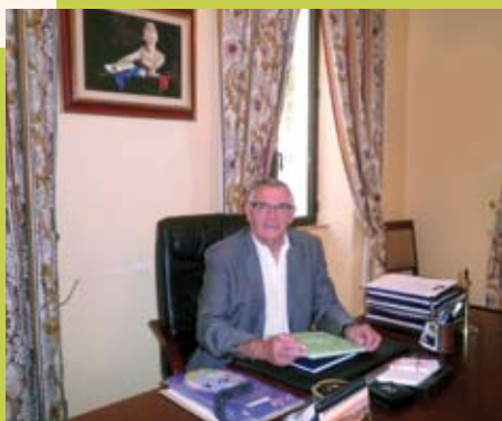
Meilleurs vœux pour 2012