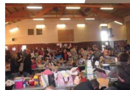
Bourse aux jouets - 70 exposants !