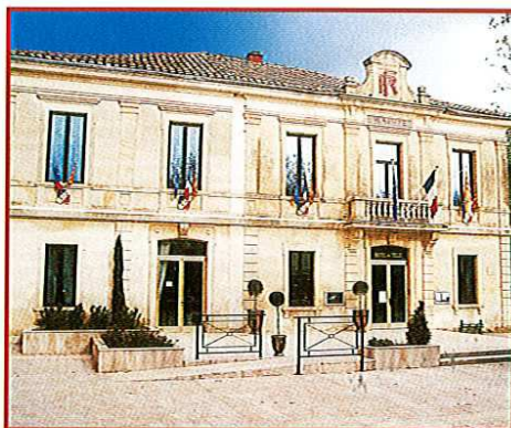
L'information municipale en direct