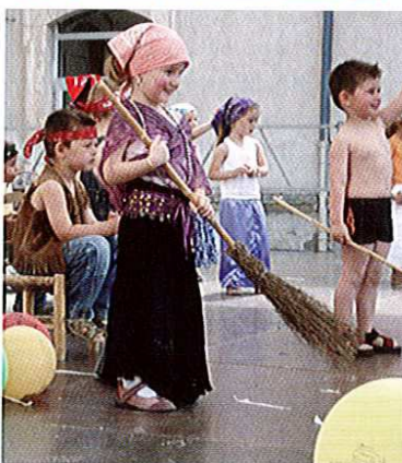
Derniers regards sur la kermesse des enfants des écoles