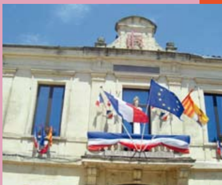
L'information municipale en direct