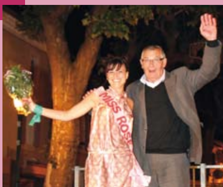
Félicitations à Miss Rosé 2010 Fête du Rosé : Dimanche 8 Août 2010