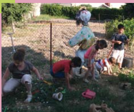
À l'honneur LE RÉSEAU GOUTTE D'EAU