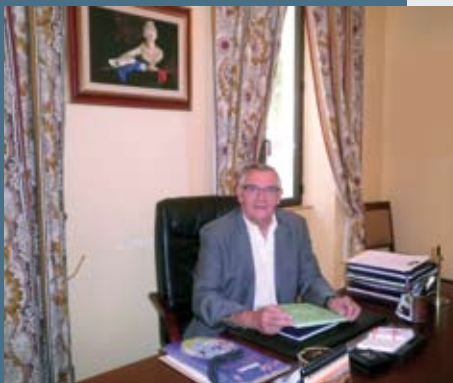
L'information municipale en direct