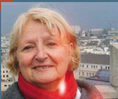
Hommage à Christiane Criscuolo