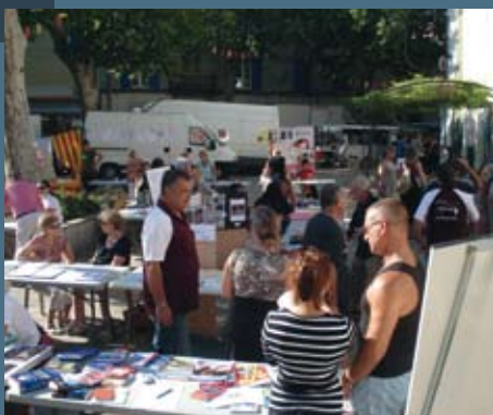
Félicitations pour la réussite de la matinée des associations