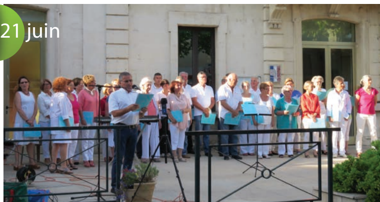
Chorale Choeur Sainte Cécile. Premier concert pour la fête de la musique du 21 juin.