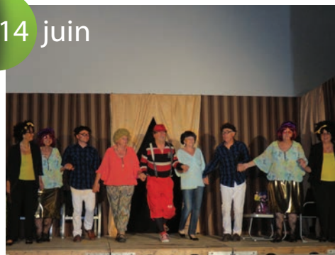
Les Amis de Phidias ont offert une joyeuse pagaille. Pièce interprétée par les Compagnons du Phoenix de Rochegude.