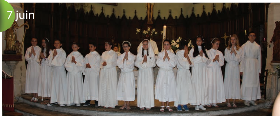
Profession de foi de 14 jeunes de l'aumônerie de Sainte-Cécile-les-Vignes.