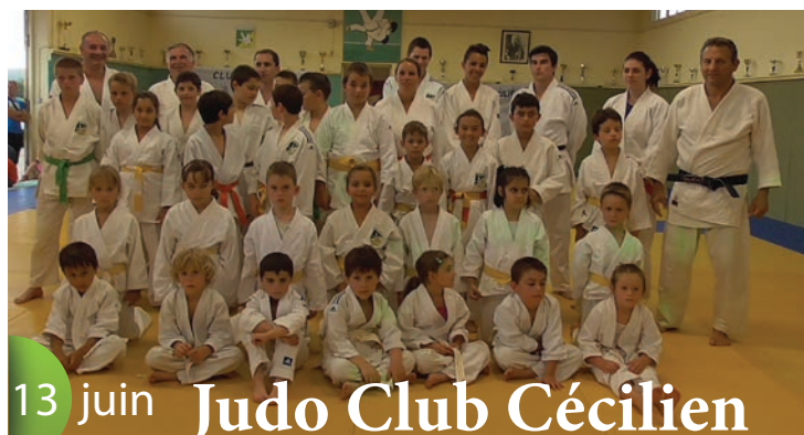
13 juin Judo Club Cécilien Photo de famille