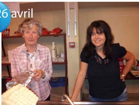
C'est toujours une fête, les vide-greniers de l'ASPC. Association pour la Sauvegarde du Patrimoine Cécilien.