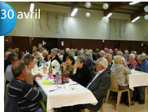
La beauté du geste. Corbeille de printemps de la Boule Cécilienne