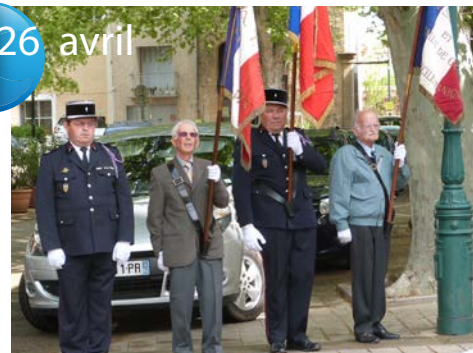
Journée du Souvenir.