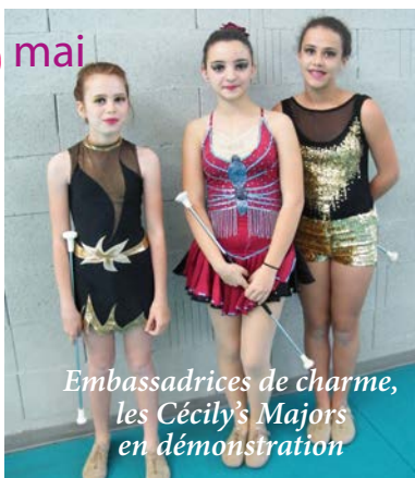
Embassadrices de charme, les Cécily's Majors en démonstration