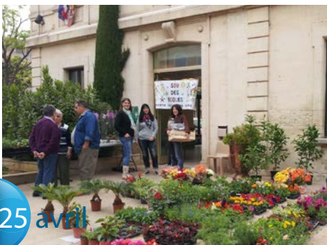
Le Sous des Ecoles fait son marché aux fleurs. Un parvis de la mairie multicolore !