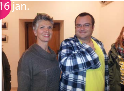
Vernissage Photos de Laurent Santi. Un Cécilien né avec l'appareil qui sait capter l'image de son village !