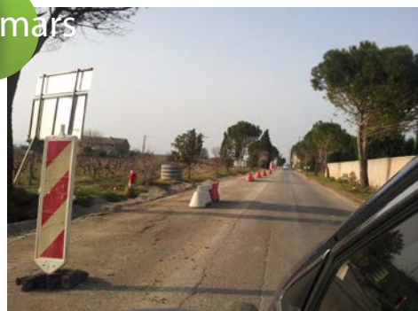
Route de Suze renforcée sur les à-côtés.