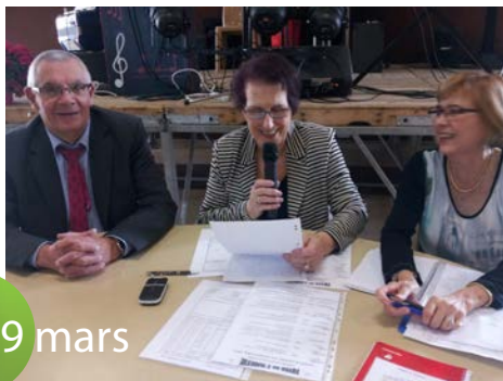
Assemblée Générale du Foyer de l'Amitié. Des bilans positifs, des adhérents heureux de participer aux nombreuses manifestations.