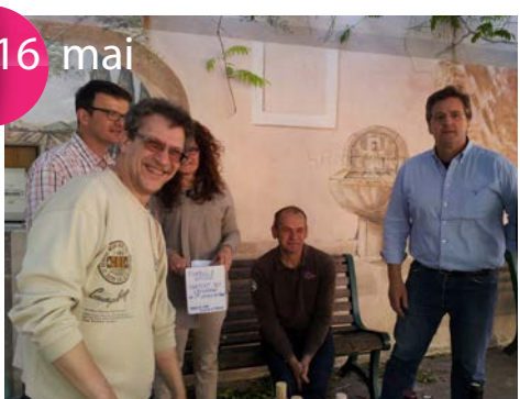
Fête de la Vigne et du Vin dans les caves. Tirage de la tombola des Vignerons.