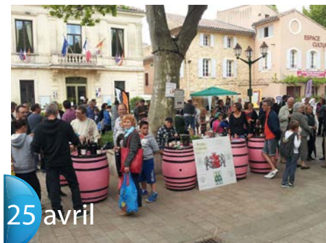
Printemps Cécilien. Tous dans la rue. Tous venus saluer nos commerçants, artisans, vignerons.