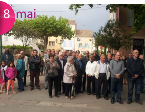
Commémoration de la Victoire de 1945.