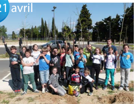
Les enfants du TAP plantent 100 arbres au pôle Educatif, le Petit Prince