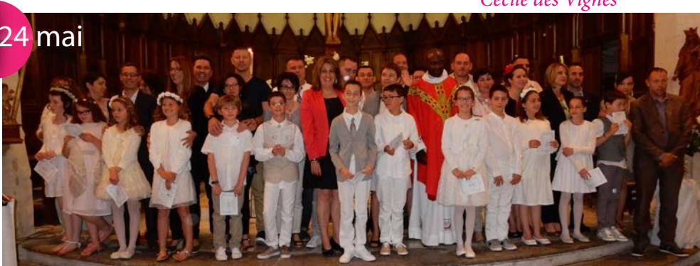
Première communion de 13 jeunes enfants, accompagnés de leurs parents, rayonnants de joie et d'allégresse.