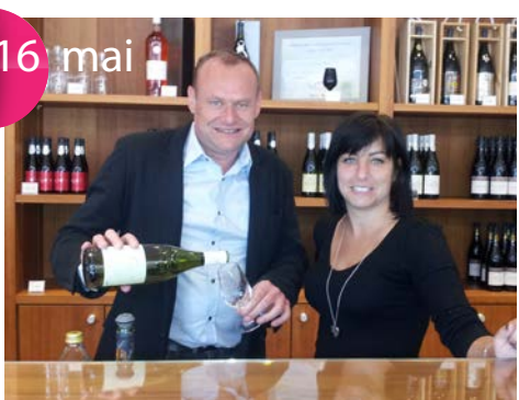
Fête de la Vigne et du Vin Caveau Cécile des Vignes