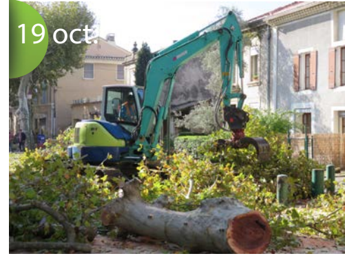
Début des travaux avenue Charles de Gaulle. Arrachage des platanes.