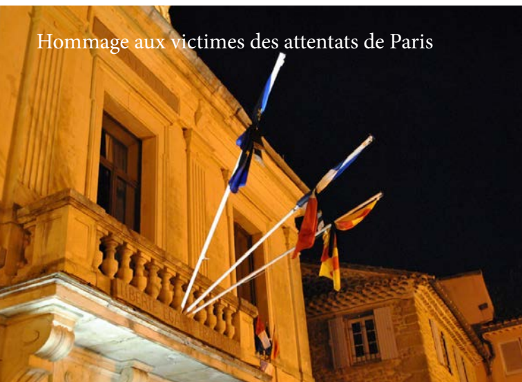
Hommage aux victimes des attentats de Paris