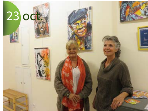
Exposition des oeuvres de Marie Chevalier, peintre.