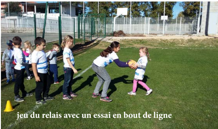
jeu du relais avec un essai en bout de ligne