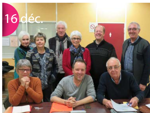
Journée Nationale. Hommage aux Morts pour la France de la guerre d'Algérie, combats du Maroc et de la Tunisie, cette année à Lagarde Paréol.