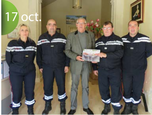
Présentation en mairie du nouveau calendrier 2016 des Pompiers Céciliens.