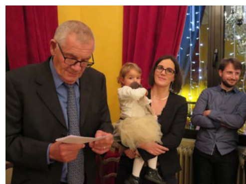
Le Père Noël accueille les enfants des employés municipaux. Le Maire Max Ivan fait le bilan de l'exercice 2015.