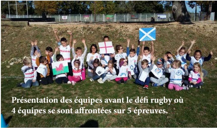
Présentation des équipes avant le défi rugby où 4 équipes se sont affrontées sur 5 épreuves.