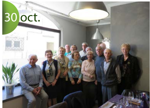
La classe 35 fête les 80 ans !