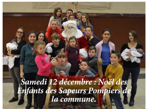
Samedi 12 décembre : Noël des Enfants des Sapeurs Pompiers de la commune.

Association Mots@Mots en représentation au Caveau Chantecôtes. Lectures théâtralisées d'Alphonse Allais. 1 ère représentation le vendredi 14 décembre 2015.