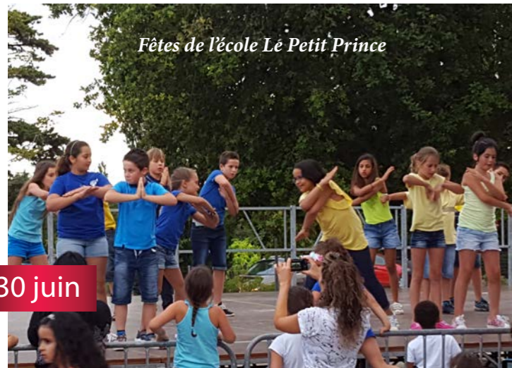
Fêtes de l'école Le Petit Prince