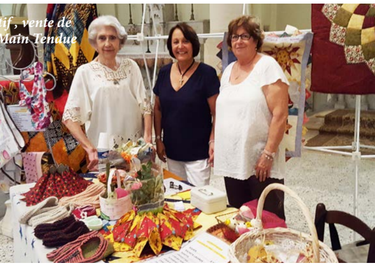
Messe en provençal, animée par la chorale, apéritif, vente de gâteaux et belles réalisations de l'Association La Main Tendue