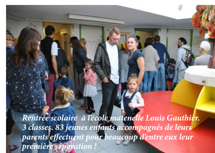
Rentrée scolaire à l'école maternelle Louis Gauthier. 3 classes. 83 jeunes enfants accompagnés de leurs parents effectuent pour beaucoup d'entre eux leur première séparation !