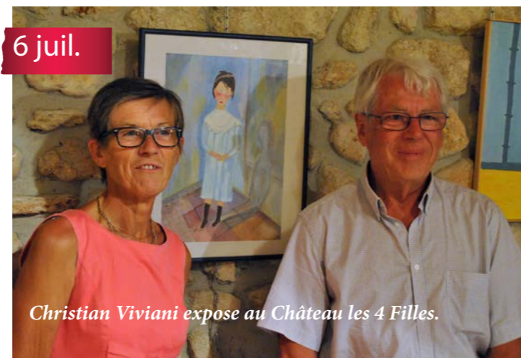
Superbe exposition partagée ! Peinture Fred Mathieu, photographies Pascal Druelle.