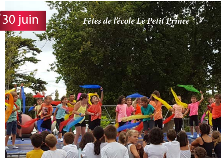
Fêtes de l'école Le Petit Prince