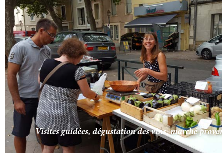
Visites guidées, dégustation des vins, marché provençal. Les mardis de l'été