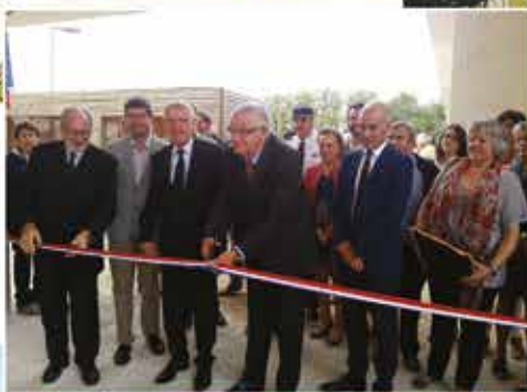
Inauguration du 11 octobre 2014