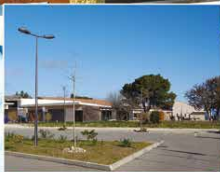
Ecole primaire Le Petit Prince