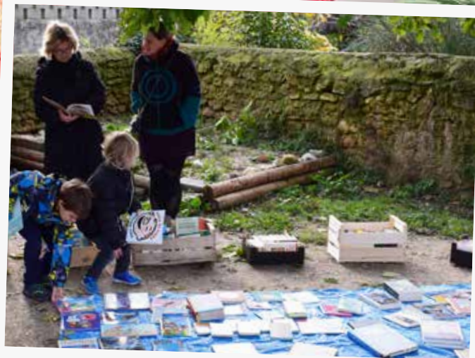
► Le 12 décembre. Vide-graniers à l'école Montessori

► Décembre - Dernier Cercle littéraire 2019 où les échanges sur le livre de Saskia Sarginson : l'Etranger à ma porte- a suscité de nombreuses interrogations.