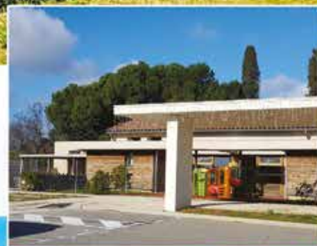
Crèche - Pôle Educatif