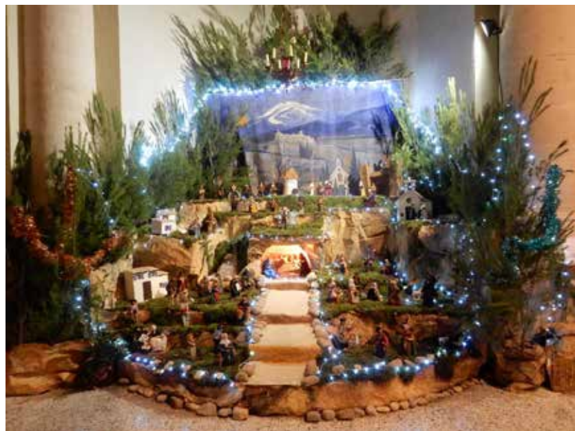
► Crèche de l'Eglise Paroissiale.