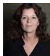
Maylis de Kérangal