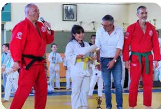
Le 15 Juin 2024 en fin d'après-midi, L'Association Judo club francombat cécilien

avait lieu la Grande Fête de fin de saison du JUDO CLUB FRANCOMBAT CECILIEN 2023-2024.